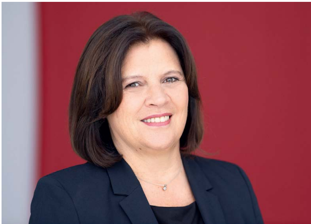
Renate Anderl AK PRÄSIDENTIN

„ Ohne Ausbildung keine Zukunft. Qualität in der Lehrausbildung und eine abgeschlossene Berufsausbildung für alle Jugendlichen sind uns besonders wichtig.